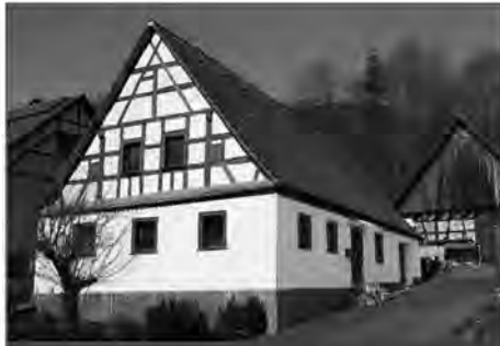
Unterleinleiter: Fränk. Bauernhaus