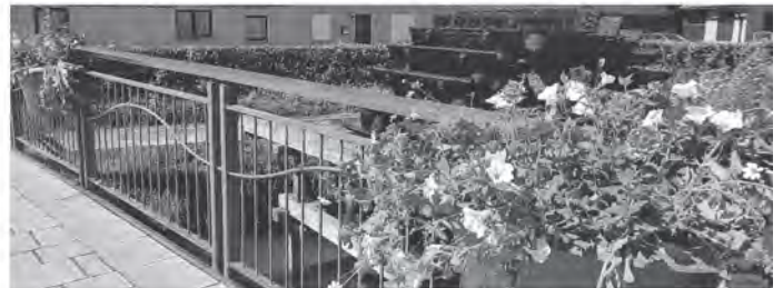
Die Blumen bei der Brücke am Oberen Tor

Damit die Innenstadt für das 700-jährige Stadtjubiläum herausgeputzt wird, erfolgte Anfang Mai eine Begrünung in der Unteren und Oberen Hauptstraße. Damit soll die Innenstadt grüner, bienenfreundlicher und vor allem auch blühender werden.