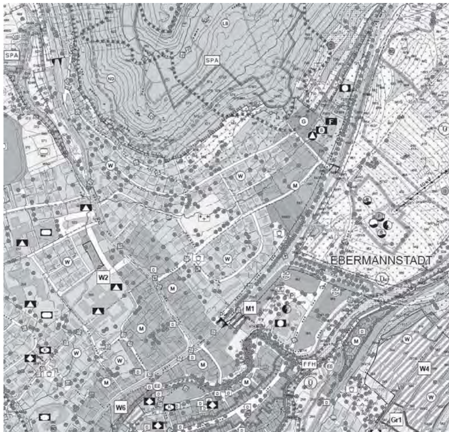
Abb. 1: Ausschnitt Entwurf, Gesamtfortschreibung Flächennutzungsplan Ebermannstadt, Stand: 06.02.2023